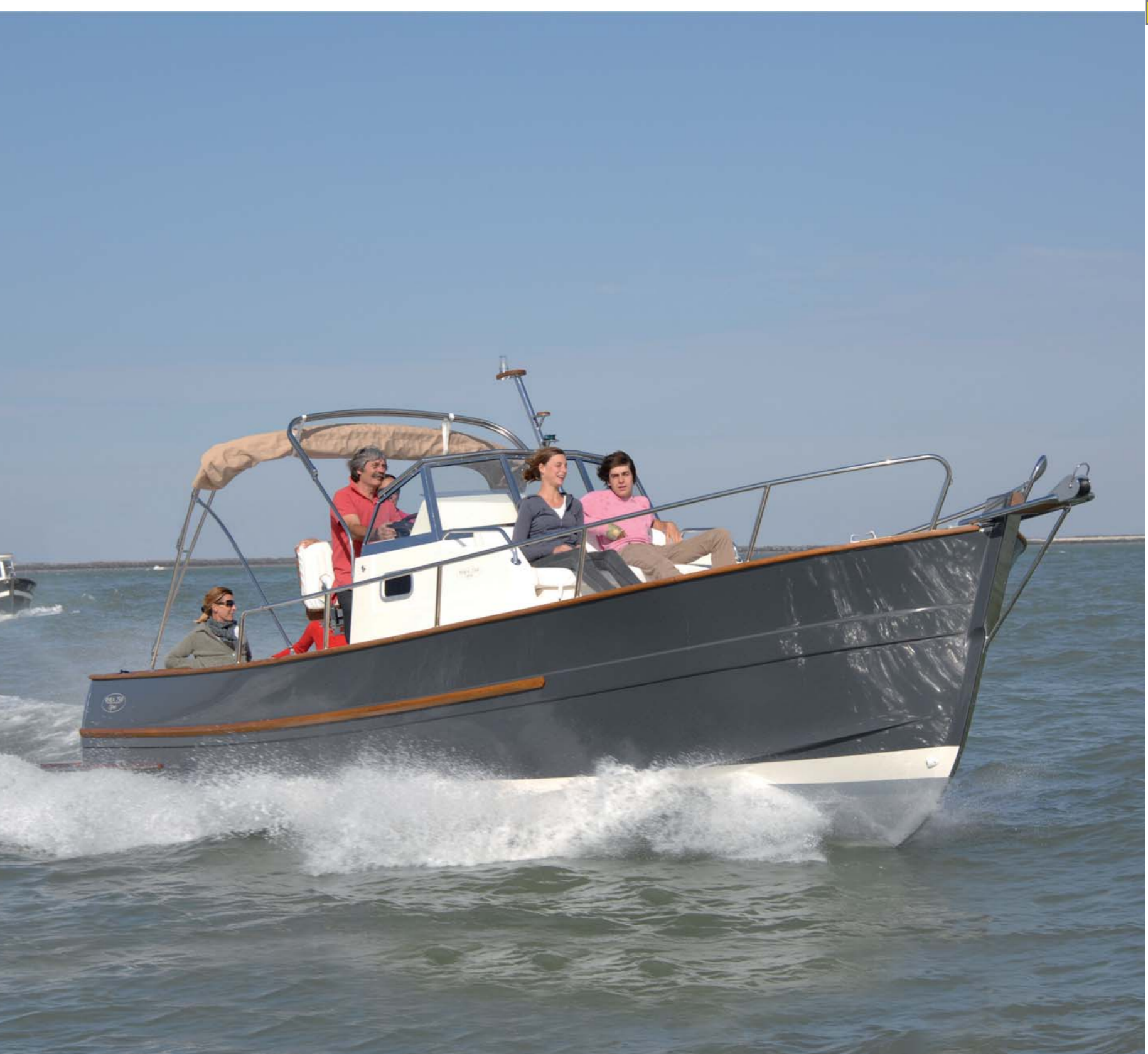
d/ce - communication - Cédric photos - Yves Renzette

Novembre 2010 - Document non contractuel. RHEA MARINE se réserve le droit d'apporter toutes les modifications à ses modèles sans préavis. This document is not binding. RHEA MARINE reserves the right to alter its models at any time without notice.